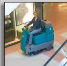
Machine in actie